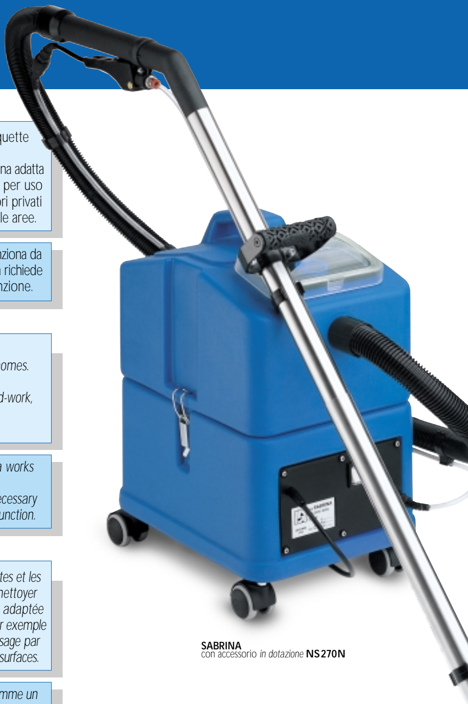
SABRINA con accessorio in dotazione NS270N