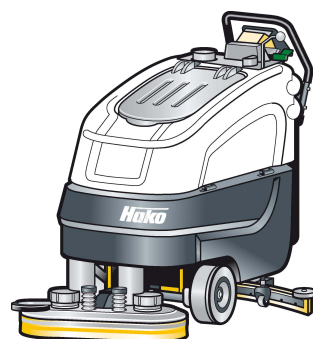
Hakomatic B 70 CLH