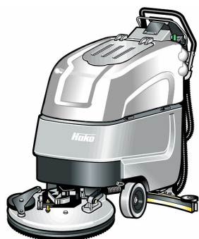
Hakomatic B 45 CLH

La versione Hospital delle Hakomatic è stata sviluppata appositamente per utilizzo in ospedali, case di cura e tutti i luoghi in cui è necessaria una bassissima rumorosità: equipaggiate con serbatoio bianco, dotate di una speciale pacchetto di riduzione rumore dei motori e insonorizzate nella carrozzeria, queste macchine sono particolarmente silenziose.